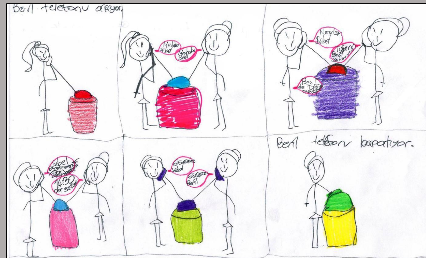
Resim 2. “Telefonla konuşma.”